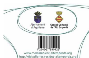
Targetes dels usuaris de la instal·lació